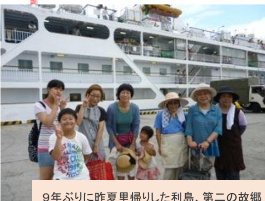
9 年ぶりに昨夏里帰りした利島、第二の故郷

「自治医大卒業生 女性医師支援 NEWS」では、読者の皆様からのご意見をお待ちいたしております。特集記事のテーマ、絵本やその他のコーナーについても、ご希望などあれば、是非お寄せください。