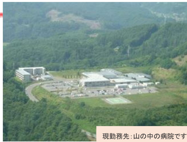
現勤務先: 山の中の病院です

ハツ場ダムで有名な長野原町の小病院に勤務し、早や 12 年が経過しました。地域で普通の子持ち女医がどんな風に無事に働き続けているのか、私の体験を記そうと思います。