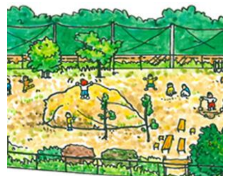
こくぶんし 国分寺市プレイステーション しょうないず 場内図

本を読んだりおしゃべりしたり、のんびりしたりおやつ作り、クラブや卓球なども。相談室もあります。予約すれば大人も子どももカウンセラーに個別に悩み相談、子育て相談ができます。