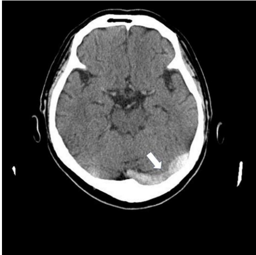
図1：脳静脈洞血栓症発症時の頭部単純CT