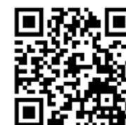
血液科ホームページ